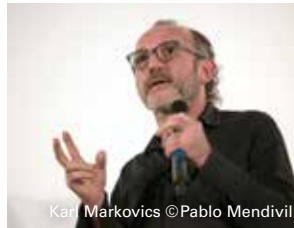
Karl Markovics