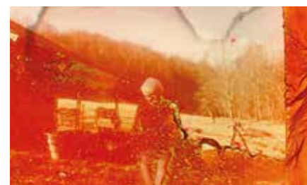
Grand Jury Prize (Animation) Quiet Zone (CAN) Regie: Karl Lemieux, David Bryant