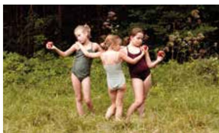
Bester Film – Österreich-Wettbewerb Wald der Echos (AT) Regie: Maria Luz Olivares Capelle