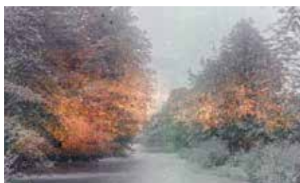
Bester Film – Animation Avantgarde Vintage Print (AT) Regie: Siegfried A. Fruhauf