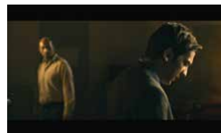
Grand Jury Prize (Fiction) Ennemis intérieurs (FR) Regie: Sélim Azzazi