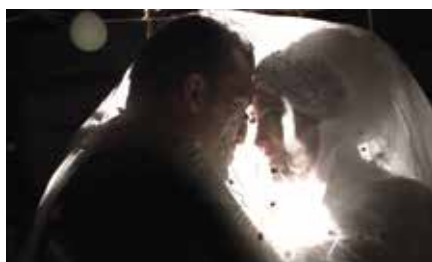
Bester Film – Fiction & Documentary A Man Returned (UK/DK/NL) Regie: Mahdi Fleifel