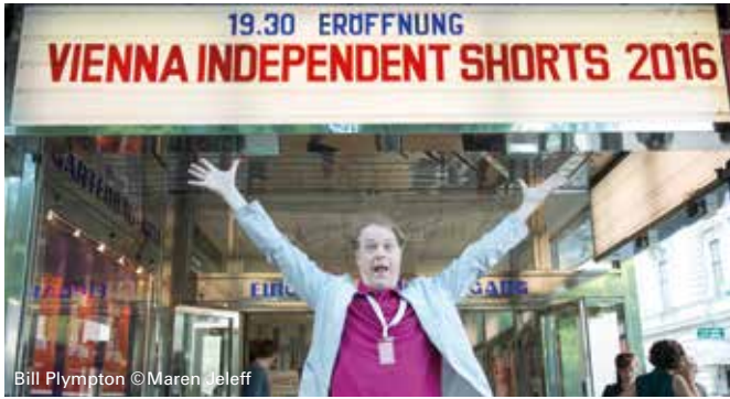
Bill Plympton