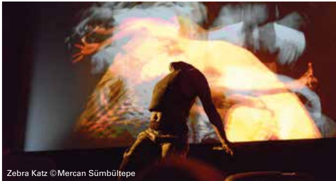
Zebra Katz