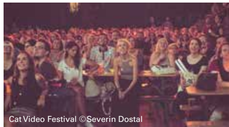
Cat Video Festival